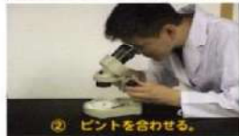
② ピントを合わせる。