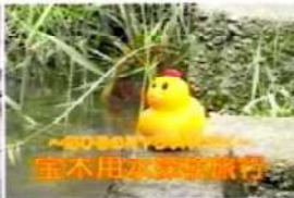
宝木用水探検旅行