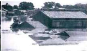
小学校社会科 4年 「土地の低いところに住む人びとの暮らし」 — 小山市生井地区 —

県内の特色ある地域の1つとして、小山市生井地区を取り上げました。この地域は、思川・巴波川・与良川の3つの川にはさまれ、土地が低いため雨が降ると川が氾濫して水害がおきました。この地区の人々が水害とたたかいながら、どのような工夫や努力をしてきたかを映像化し、小学校4学年社会科で利用できるようにしました。